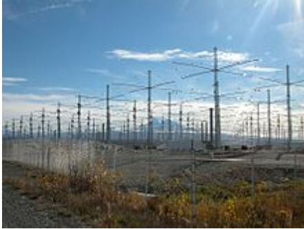
HAARP na Aljašce

Na meranie zmien geomagnetickeho poľa vyvolaného HAARP sa používal Magnetometer umiestnený až v Antarktíde. Pozrime sa čo to je a sami porozmýšľajme prečo je práve tam a prečo až tak ďaleko: